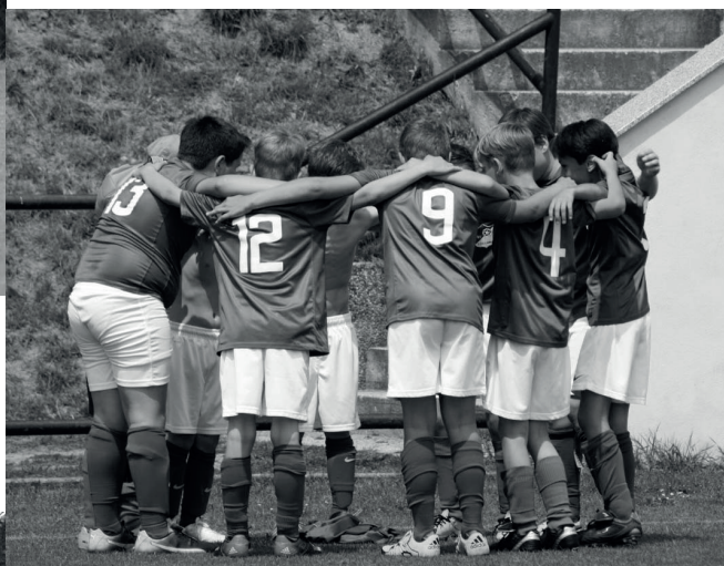
U10 nach dem Sieg gegen Gr.Weikersdorf am 11.6.2016