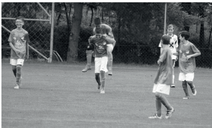
U13 Spieler nach einem Torerfolg