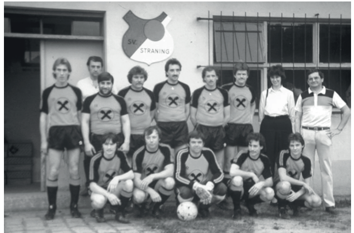
Dressenspende der Raika Eggenburg, 1985

Stattdessen erfolgte aber eine Neuerrichtung der Sportanlage mit einem neuen Spielfeld (90° Drehung > wieder Lage Gaisberg - Fleischmühle), Trainingsplatz und einer neuen Kabinenanlage.