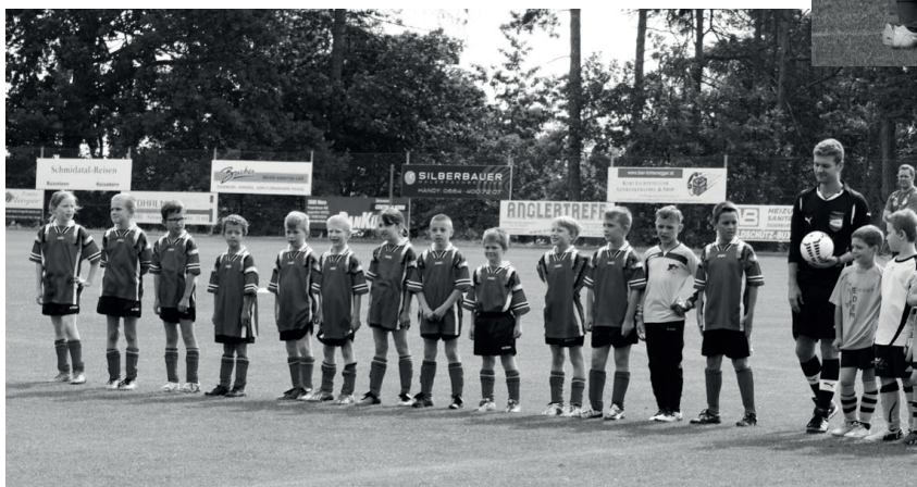
U9-Mannschaft bei Begrüßung vor Spielbeginn am 11.6.2016 gegen Göllersdorf.